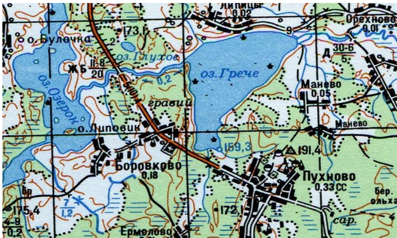
Куньинский район, вся акватория оз. Грече, (Гречно, Пухновское, Липицкое)

к Документации об аукционе на право заключения договоров пользования рыбоводными участками, расположенных на водных объектах и (или) их частях на территории Псковской области для осуществления индустриальной и (или) пастбищной аквакультуры (рыбоводства).