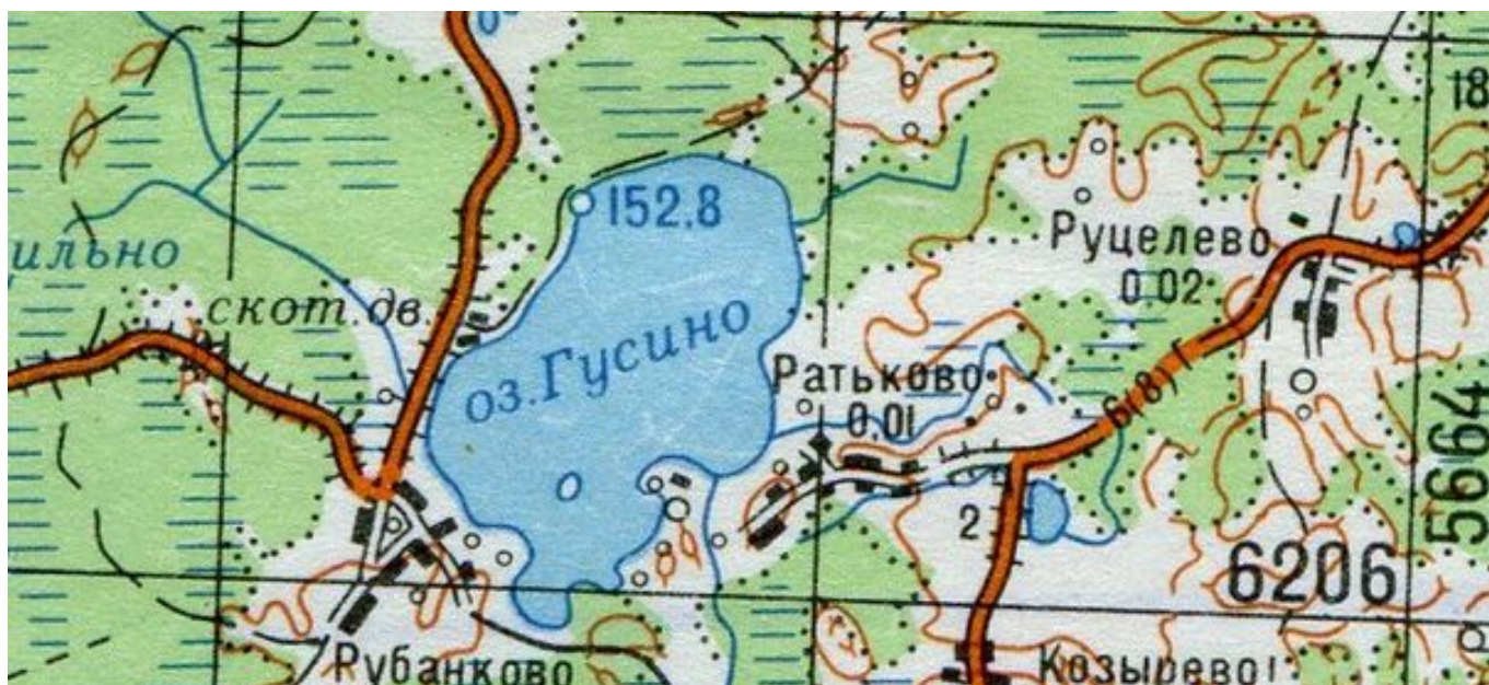
Невельский район, вся акватория озера Рубанково (Гусино) ок. д. Рубанково