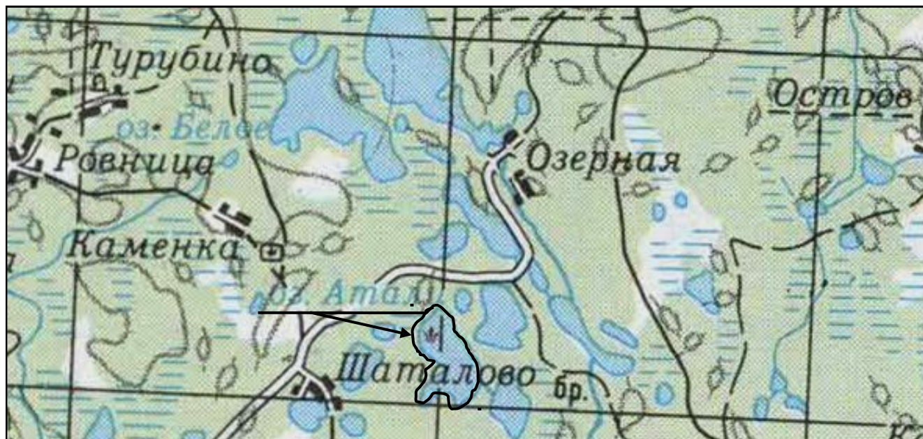
Пустошкинский район, вся акватория озера Атоли (Атали, Отоле)

к Документации об аукционе на право заключения договоров пользования рыбноводными участками, расположенных на водных объектах и (или) их частях на территории Псковской области для осуществления индустриальной и (или) пастбищной аквакультуры (рыбоводства).