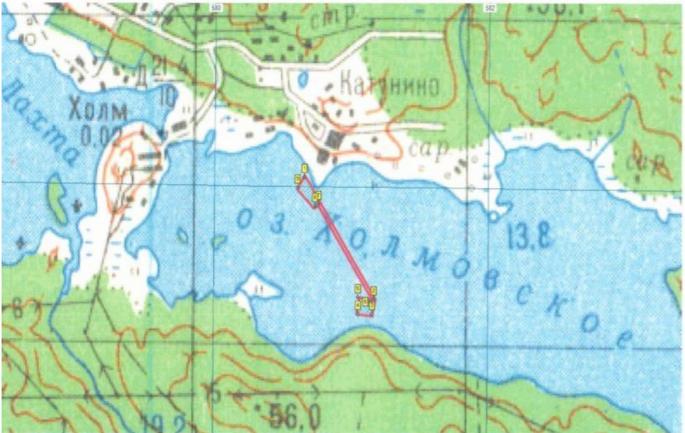
Рыбоводный участок «Озеро Холмовское»

Архангельская область, Приморский район, озеро Холмовское