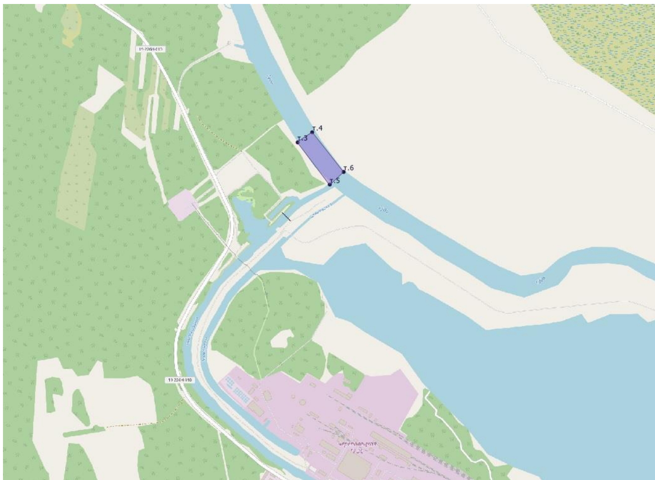
Схема водного объекта с границами рыбноводного участка

Вологодская область, Кадуйский муниципальный округ, река Суда, участок № 2, границы участка: от точки 3 с координатами 59°14'45"с.ш. 37°7'7"в.д. далее до точки 4 (59°14'47"с.ш. 37°7'13"в.д.), затем по береговой линии до точки 6 (59°14'38,950"с.ш. 37°7'25,393"в.д.), далее до точки 5 (59°14'36,299"с.ш. 37°7'19,866"в.д.), затем по береговой линии до исходной точки 3.