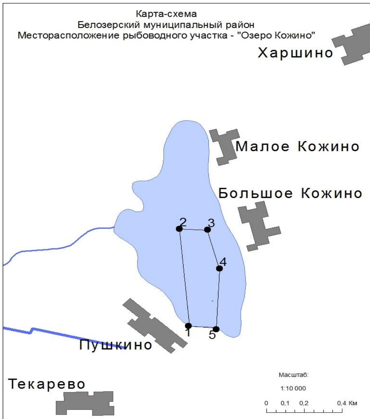
Схема водного объекта с границами рыбноводного участка.

Вологодская область, Белозерский муниципальный округ, озеро Кожино, границы участка: от точки 1 с координатами 59°56'56,19"с.ш. 37°56'20,15" в.д., далее до точки 2 (59°57'13,85" с.ш. 37°56'17,17" в.д.), затем по береговой линии до точки 3 (59°57'14,13"с.ш. 37°56'26,97" в.д.), далее до точки 4 (59°57'6,39"с.ш. 37°56'31,83" в.д.), затем до точки 5 (59°56'55,25" с.ш. 37°56'30,89"в.д.), далее по береговой линии до исходной точки 1.