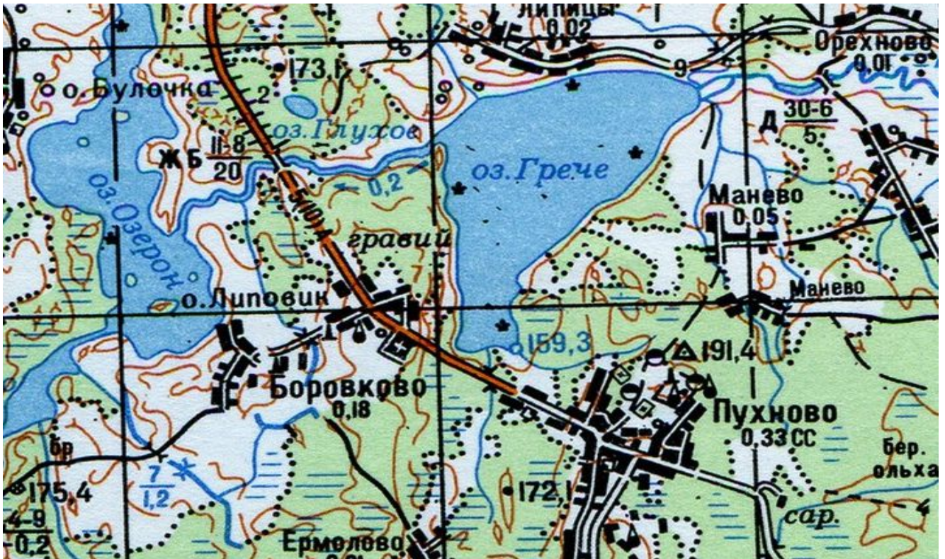
Куньинский район, вся акватория оз. Грече, (Гречно, Пухновское, Липицкое)

К Извещению о проведении аукциона на право заключения договоров пользования рыбноводными участками, расположенных на водных объектах и (или) их частях на территории Псковской области для осуществления индустриальной и (или) пастбищной аквакультуры (рыбоводства).