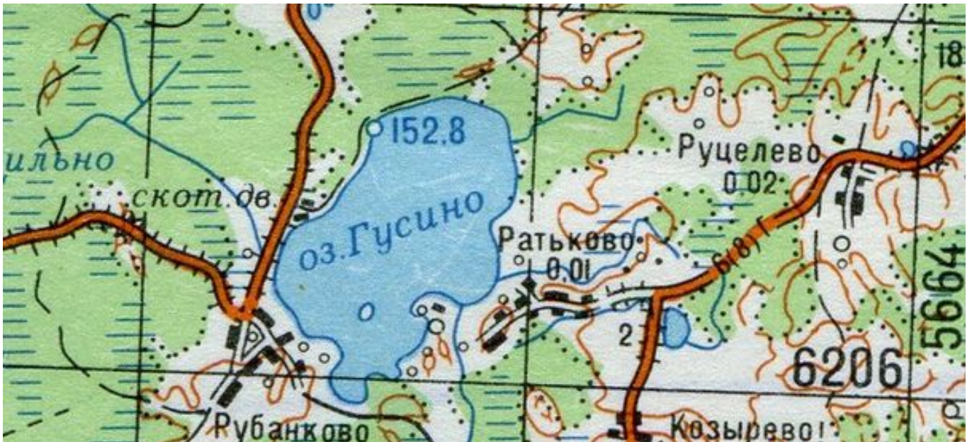
Невельский район, вся акватория озера Рубанково (Гусино) ок. д. Рубанково

К Извещению о проведении аукциона на право заключения договоров пользования рыбноводными участками, расположенных на водных объектах и (или) их частях на территории Псковской области для осуществления индустриальной и (или) пастбищной аквакультуры (рыбоводства).