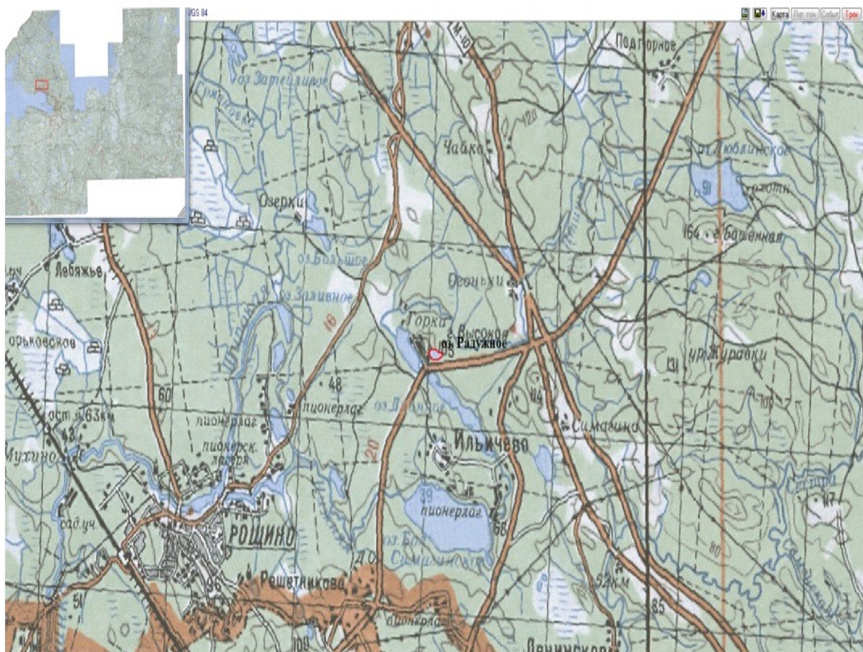
Схема рыболовного участка озеро Радужное.

к Извещению о проведении аукциона на право заключения договоров пользования рыболовными участками, расположенными на водных объектах и (или) их частях на территории Ленинградской области для осуществления индустриальной и (или) пастбищной аквакультуры (рыбоводства).