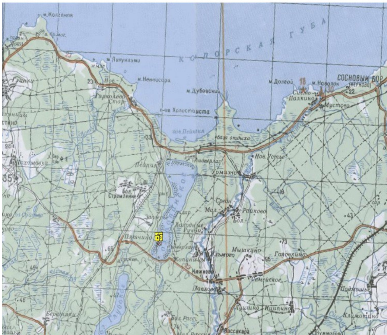
Схема рыбоводного участка № 22 озеро Копанское.

к Извещению о проведении аукциона на право заключения договоров пользования рыбоводными участками, расположенными на водных объектах и (или) их частях на территории Ленинградской области для осуществления индустриальной и (или) пастбищной аквакультуры (рыбоводства).