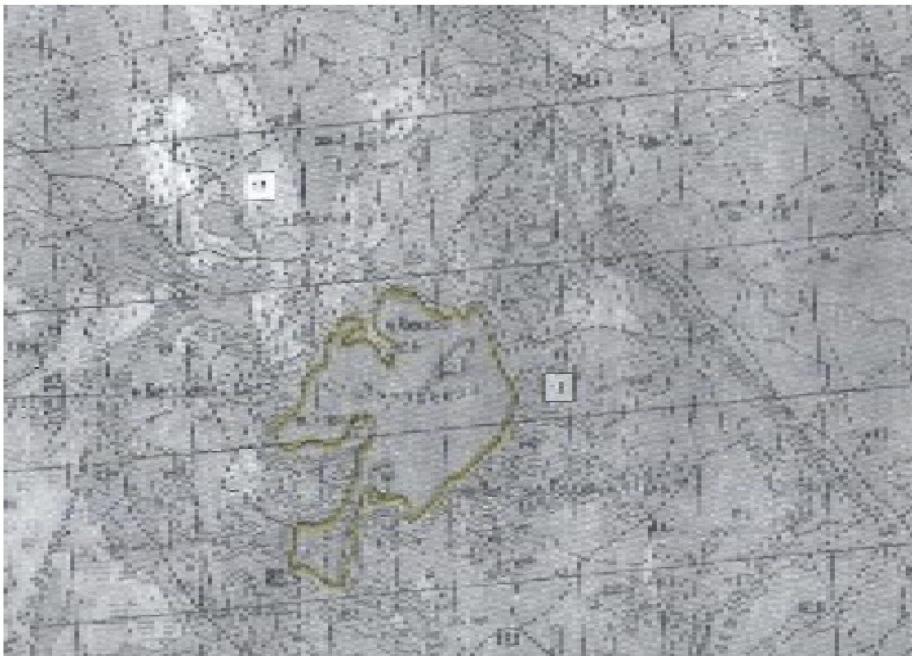
Ленинградская область, Приозерский район, озеро Воробьево, вся акватория

к Документации о проведении аукциона на право заключения договоров пользования рыбоводными участками, расположенными на водных объектах и (или) их частях на территории Ленинградской области, для осуществления индустриальной и (или) пастбищной аквакультуры (рыбоводства).