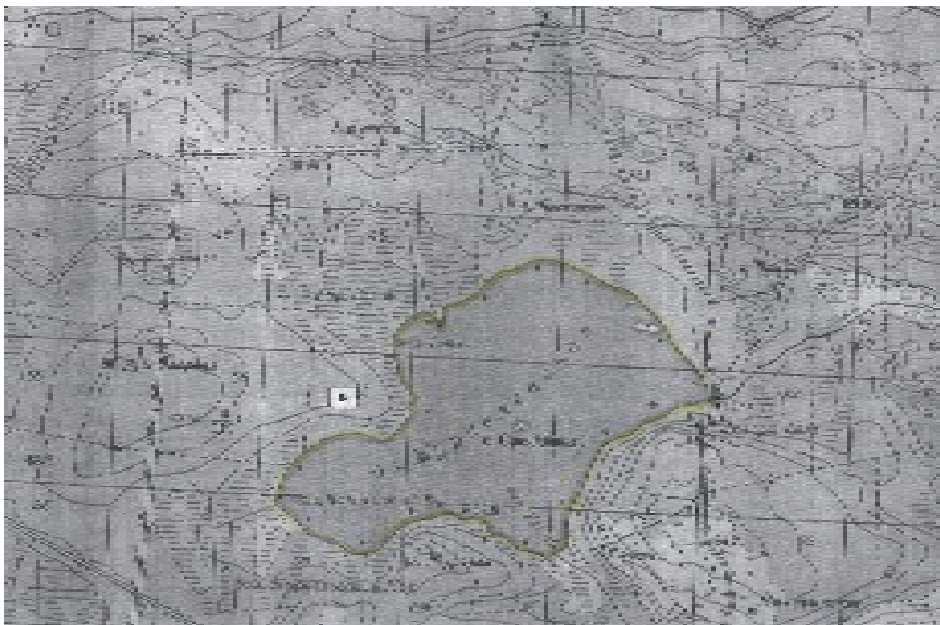
Ленинградская область, Приозерский район, озеро Журавлевское, вся акватория

к Документации о проведении аукциона на право заключения договоров пользования рыбноводными участками, расположенными на водных объектах и (или) их частях на территории Ленинградской области, для осуществления индустриальной и (или) пастбищной аквакультуры (рыбоводства).