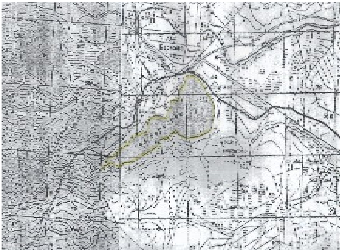
Ленинградская область, Приозерский район, озеро Борисовское, вся акватория

к Документации о проведении аукциона на право заключения договоров пользования рыбоводными участками, расположенными на водных объектах и (или) их частях на территории Ленинградской области, для осуществления индустриальной и (или) пастбищной аквакультуры (рыбоводства).