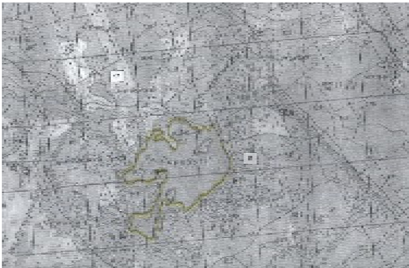
Ленинградская область, Приозерский район, озеро Воробьево, вся акватория