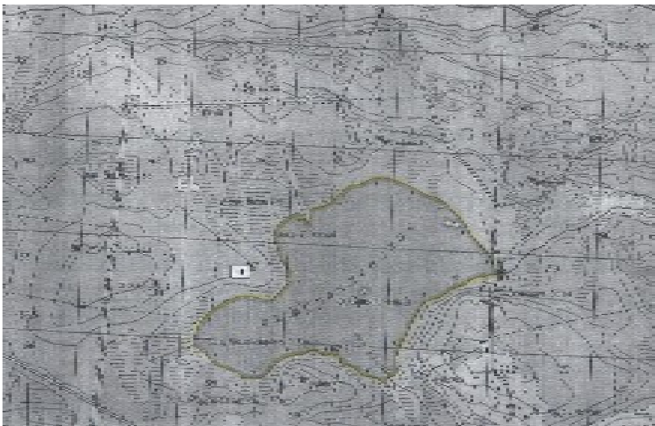
Ленинградская область, Приозерский район, озеро Журавлевское, вся акватория