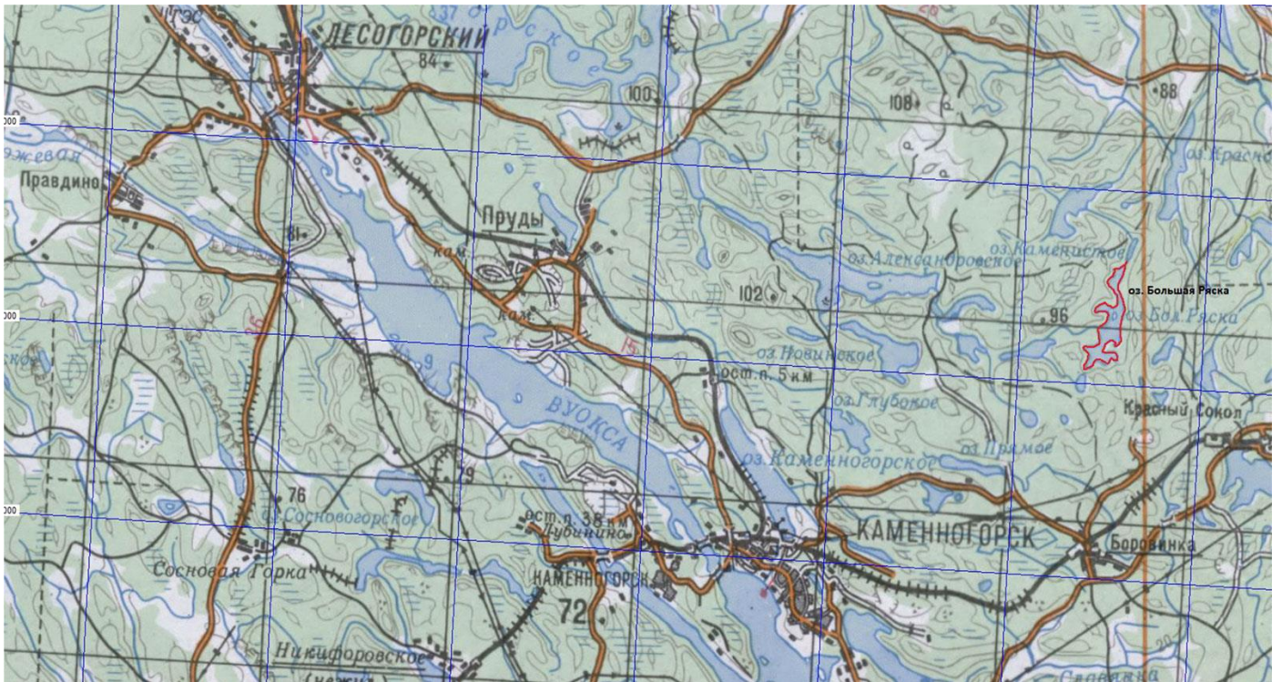
Ленинградская область, Выборгский район, озеро Большая Ряска, вся акватория.

к Извещению о проведении аукциона на право заключения договоров пользования рыбоводными участками, расположенными на водных объектах и (или) их частях на территории Ленинградской области, для осуществления индустриальной и (или) пастбищной аквакультуры (рыбоводства)