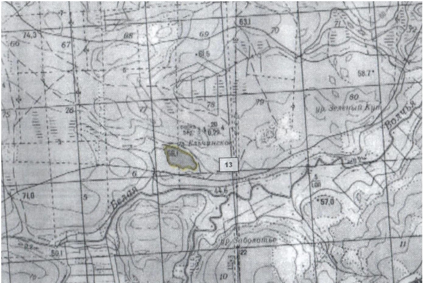
Ленинградская область, Приозерский район, озеро Ельчинское, вся акватория.

к Извещению о проведении аукциона на право заключения договоров пользования рыбоводными участками, расположенными на водных объектах и (или) их частях на территории Ленинградской области, для осуществления индустриальной и (или) пастбищной аквакультуры (рыбоводства)