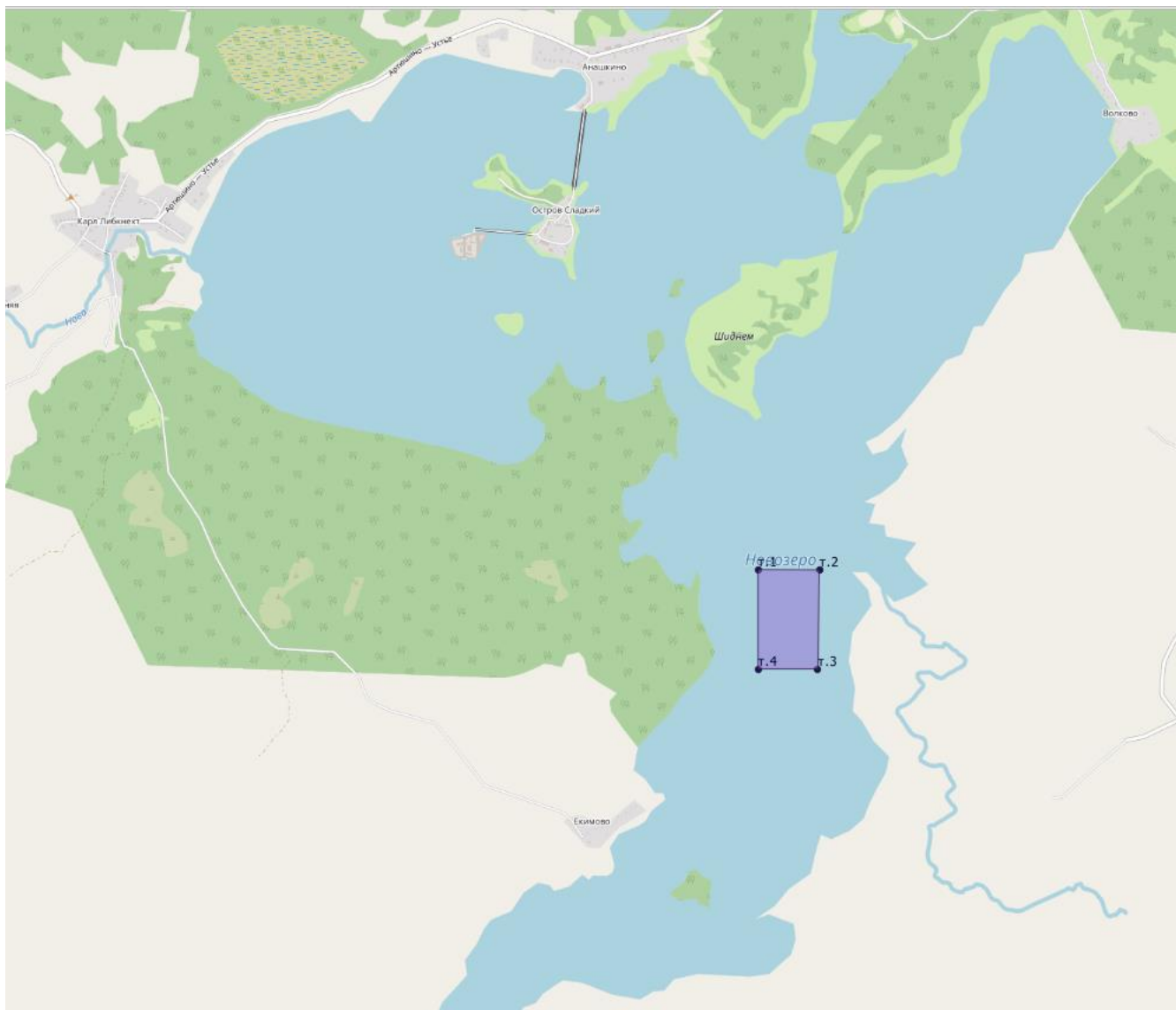
Схема водного объекта с границами рыбоводного участка.

Вологодская область, Белозерский муниципальный район, озеро Новозеро, границы участка: от точки 1 с координатами 59°56'16,0"с.ш. 37°16'1,1"в.д. далее до точки 2 (59°56'16,0"с.ш. 37°16'23,4"в.д.) затем до точки 3 (59°55'58,0"с.ш. 37°16'22,9"в.д.) далее до точки 4 (59°55'58,0"с.ш. 37°16'1,1"в.д.).