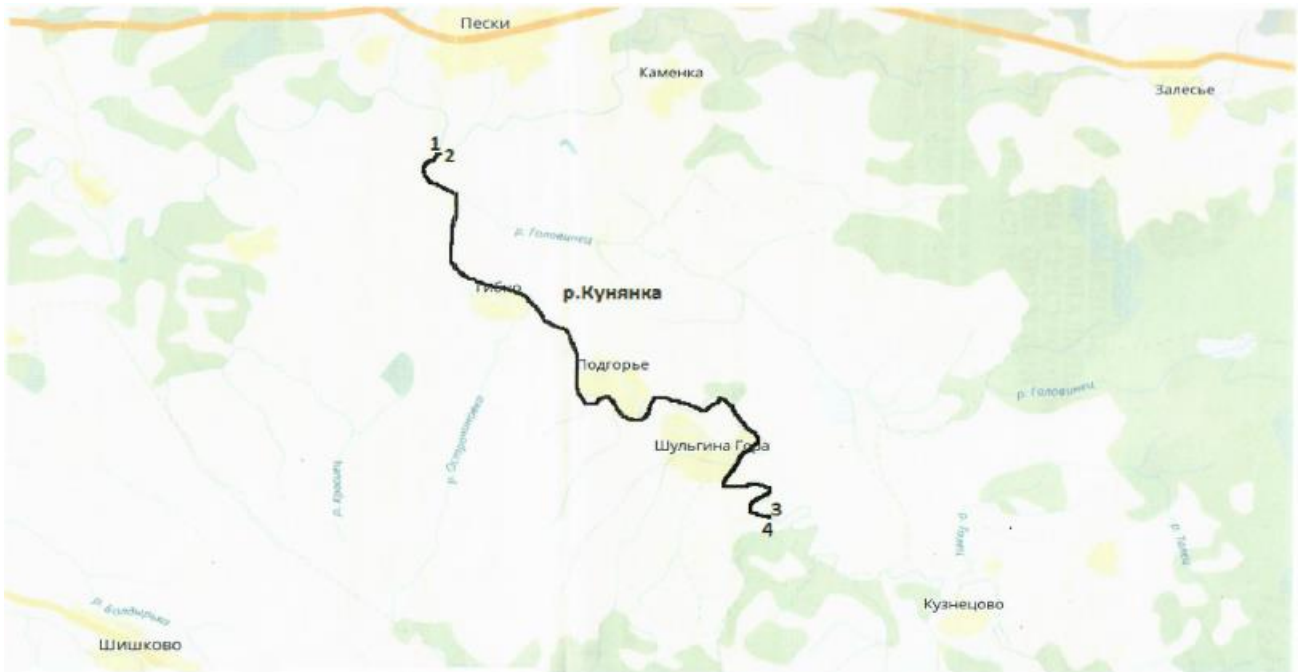
Схема водного объекта с границами рыбоводного участка

Новгородская область, Демянский муниципальный район, река Кунянка, участок № 2, координаты: